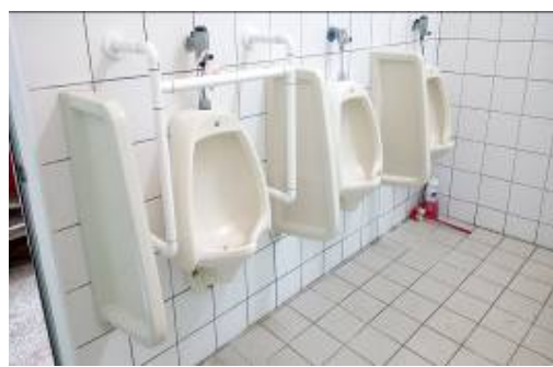
新社社區活動中心