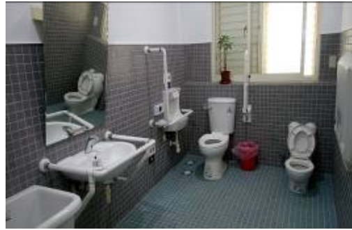
功勞社區活動中心