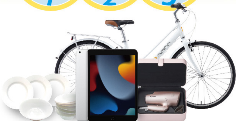
iPad、國際牌高滲透水離子吹風機、捷安特變速腳踏車等多項好禮