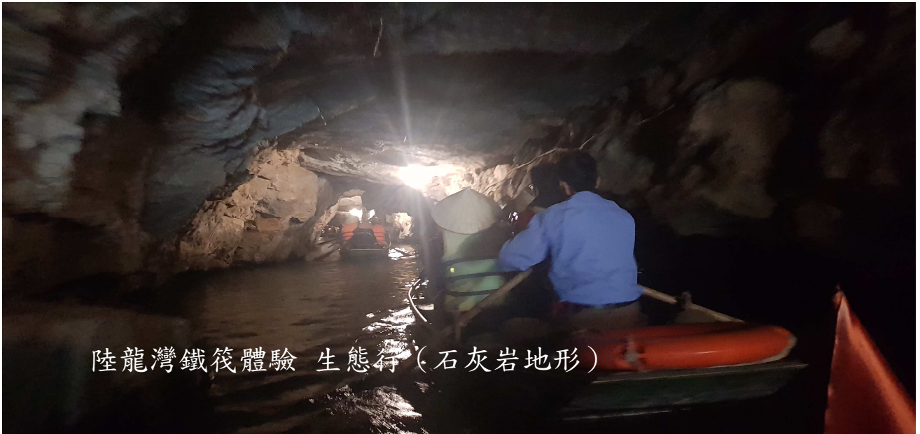
陸龍灣鐵筏體驗 生態行 (石灰岩地形)