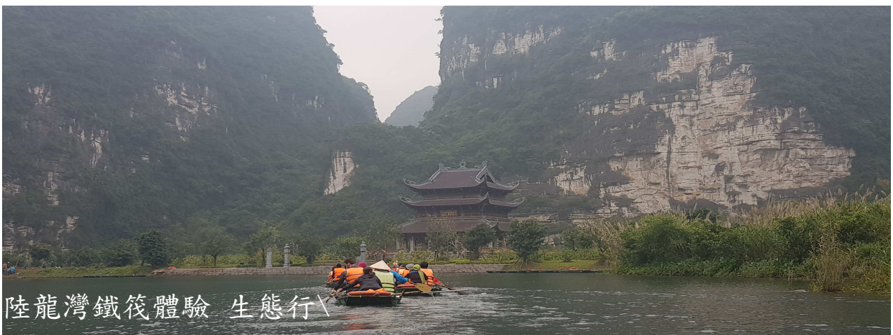
陸龍灣鐵筏體驗 生態行