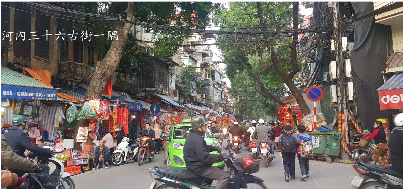
河內三十六古街一隅