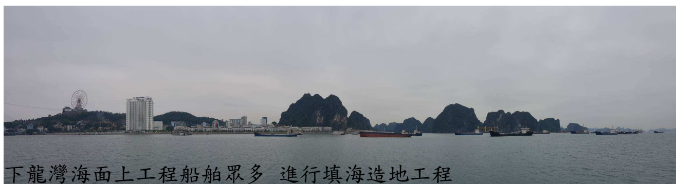
下龍灣海面上工程船舶眾多 進行填海造地工程

國內的公共建設及旅遊發展，僅在縣市型態不同，而有些許差異。經費多寡影響建設差異，工商農業型態不同，旅遊設定方向跟著改變，整體來看，台灣的旅遊環境可稱成熟。