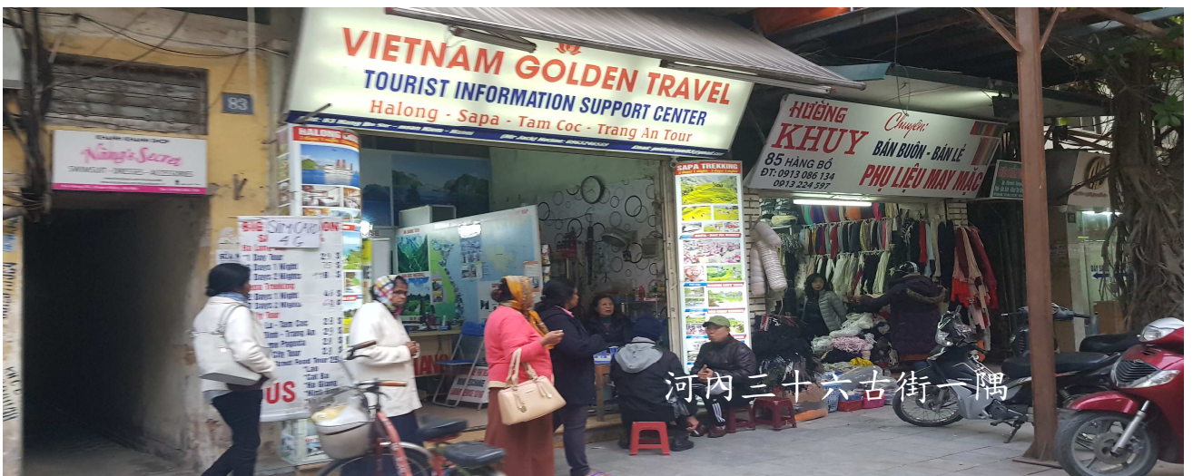
河內三十六古街一隅