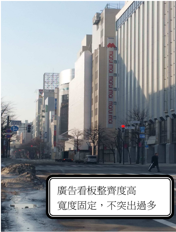
廣告看板整齊度高 寬度固定，不突出過多