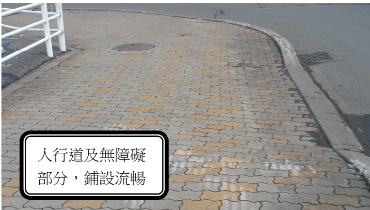
人行道及無障礙 部分，鋪設流暢