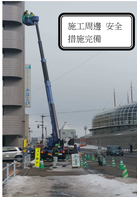
施工周邊 安全 措施完備