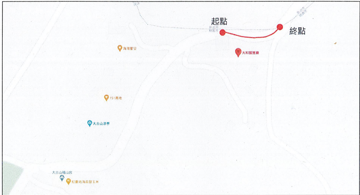
禁行大客車路線示意圖

經實地勘查本市蘆竹區大古路路段(本市蘆竹區大古路 288 號起至本市與新北市交界處)路幅狹窄，為維護行車安全，依規公告自 110 年 4 月 12 日(一)起禁行大客車進入。