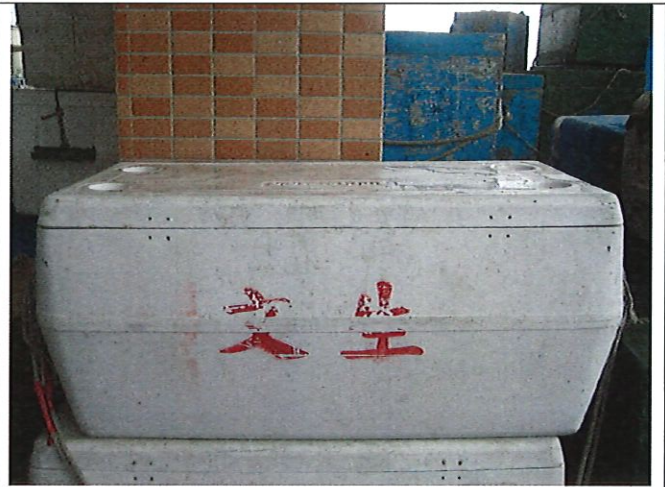
120 公斤白色冰桶(永安漁港)