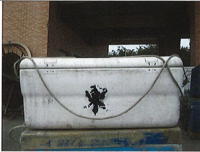
80 公斤白色冰桶(永安漁港)