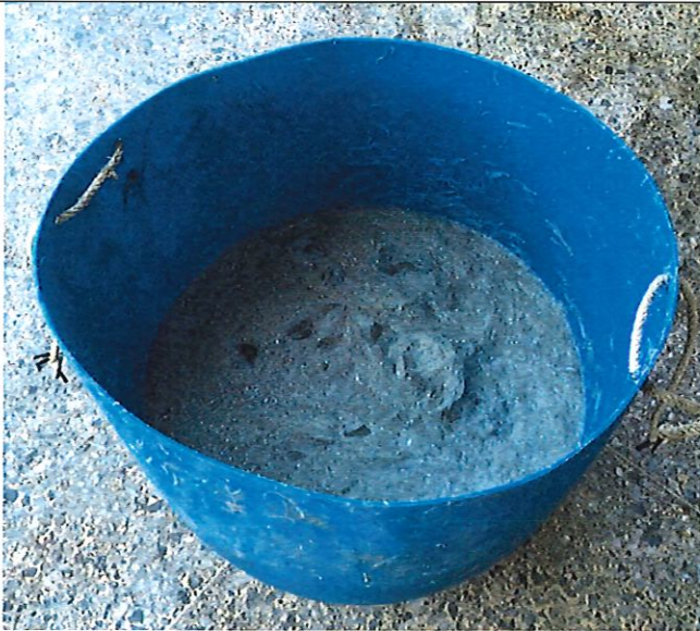
50 公斤藍色塑膠桶(竹圍漁港)