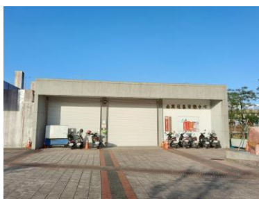
南興社區活動中心