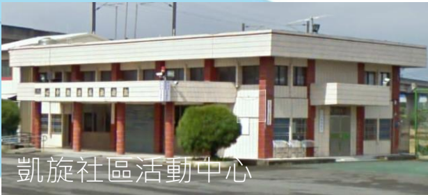
凱旋社區活動中心