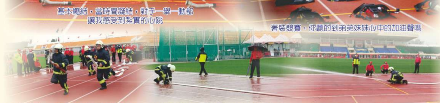
基本繩結，當時間凝結，對手一舉一動都讓我感受到紮實的心跳