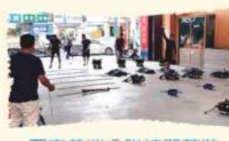
羅東義消分隊練習著裝競賽，為拚出好成績