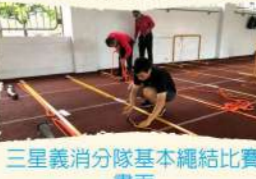
三星義消分隊基本繩結比賽畫面