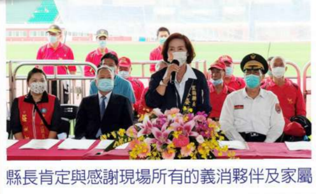
縣長肯定與感謝現場所有的義消夥伴及家屬