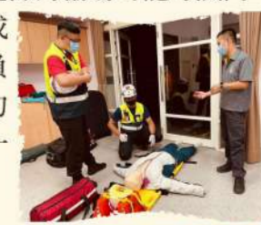
第二救護義消分隊平日救護情境練習，每一步驟檢核再檢核