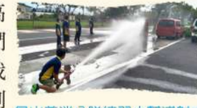
員山義消分隊練習小幫浦射水