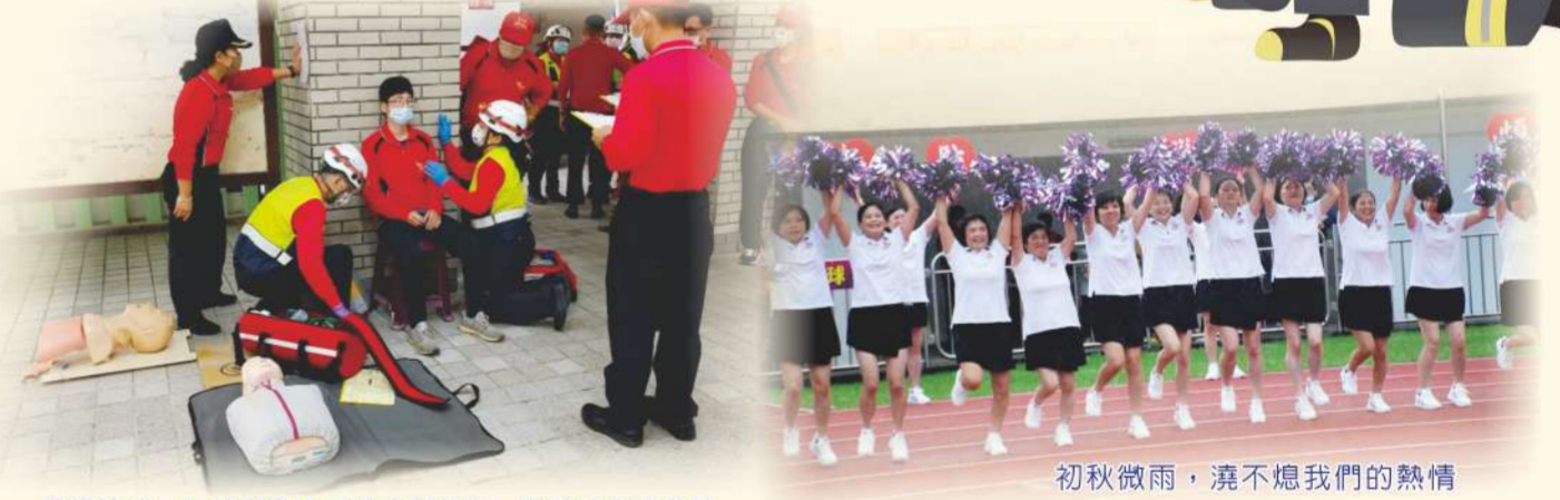
救護情境，在於慌亂中保持冷靜判斷，做最適當的處置