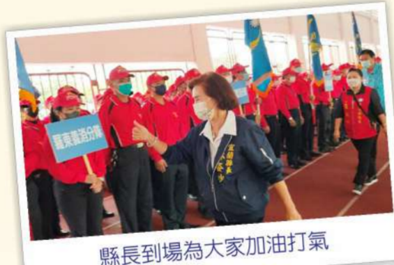
縣長到場為大家加油打氣

羅東義消分隊、宜蘭義消分隊及員山義消分隊分別榮獲總成績第一名、第二名及第三名，優秀的隊伍將於112年代表宜蘭縣義勇消防總隊掛上陣，參加全國義消競技大賽，爭取最高義消榮耀喔！