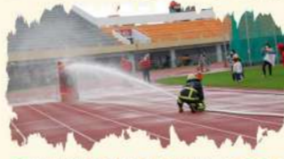
五結義消分隊小幫浦射水比賽畫面