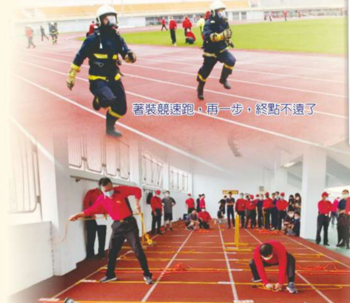
著裝競速跑，再一步，終點不遠了