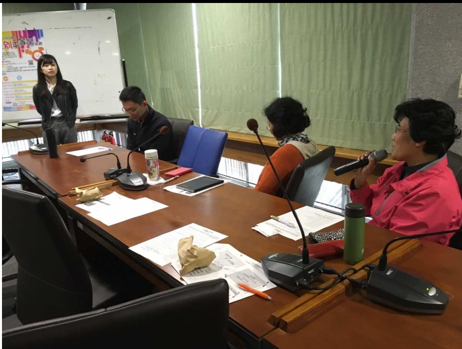
「誰是主人？女僕在勞動工作中的性別實踐」-學員發言