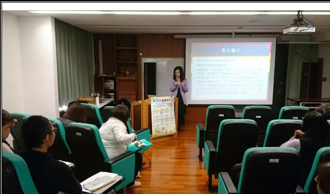
台灣伴侶權益推動聯盟講授「扣押幸福」電影座談會-談多元成家