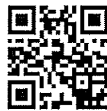
醫務社會工作協會