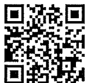
南山人壽慈善基金會