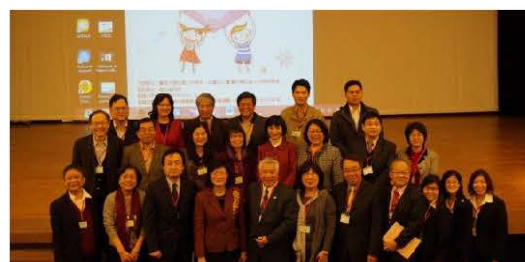
華人地區社會工作與社會福利志工國際研討會