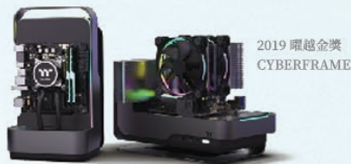
2019 曜越金獎 CYBERFRAME