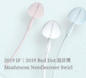
2019 IF | 2019 Red Dot 設計獎 Mushroom Needlecover Swirl