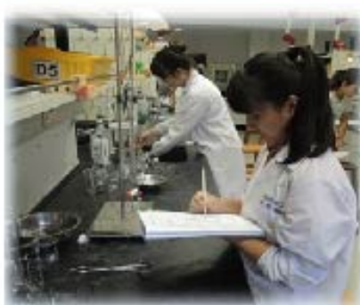
培養獨立研究能力

本系碩士班除了提供橫跨食品與營養領域的多元化課程和研究主題，亦提供學生海外參訪、企業在業學習、境外實習、境外交換學習的寶貴機會，拓展學生國際視野和提升職場競爭力。歡迎有意進修學習的在學學生和在職人士踴躍報考！