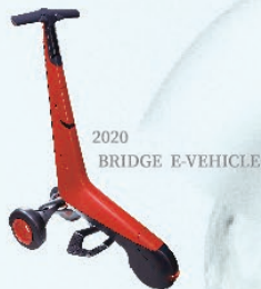
2020 BRIDGE E-VEHICLE