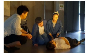
弱勢家庭生命劇場工作坊