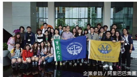
企業參訪 / 阿里巴巴集團

實踐大學財務金融學系於1992年正式成立，2006年設立研究所碩士班，本系師資團隊學術知識與實務經驗兼具，課程設計理論與實務並重，並加強金融實務運作的訓練，以配合社會與產業當前之發展趨勢，培育具備專業、資訊與實務技能兼備之金融人才。