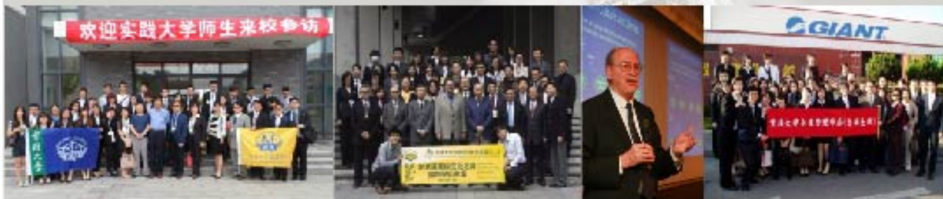
境外交流/北京大學無錫校區

實踐大學企業管理學系於民國69年正式成立，於民國84年設立研究所，為本校第一個研究所且為規模較大的學系