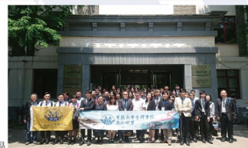
海外交流 / 蘇州大學