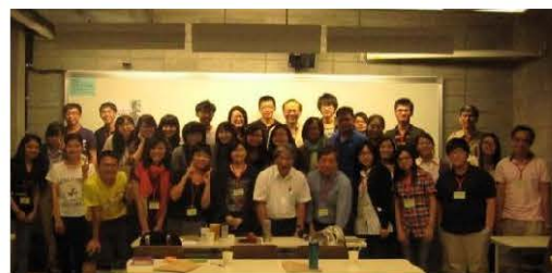
進步社會工作工作坊：香港浸會大學團隊