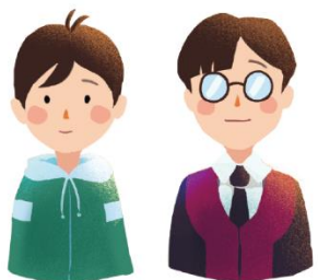
檢察官徵詢加/被害人有意願 (轉介單)