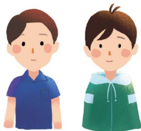
加害人、被害人自行聲請 (聲請單)