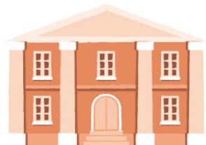
其他機關或團體轉介 (轉介單)