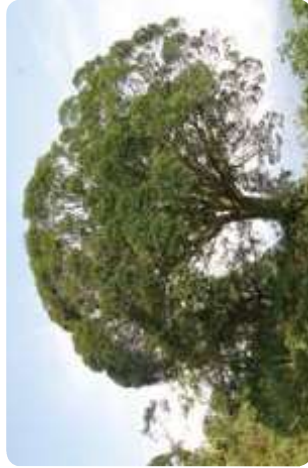
▲淋瀝老樹樹型優美，每每引起過往旅行族矚目。