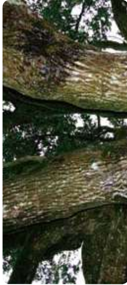
▲淋瀝老樹的枝幹中心有幾處分叉，讓它形成了擴散的圓弧樹型。