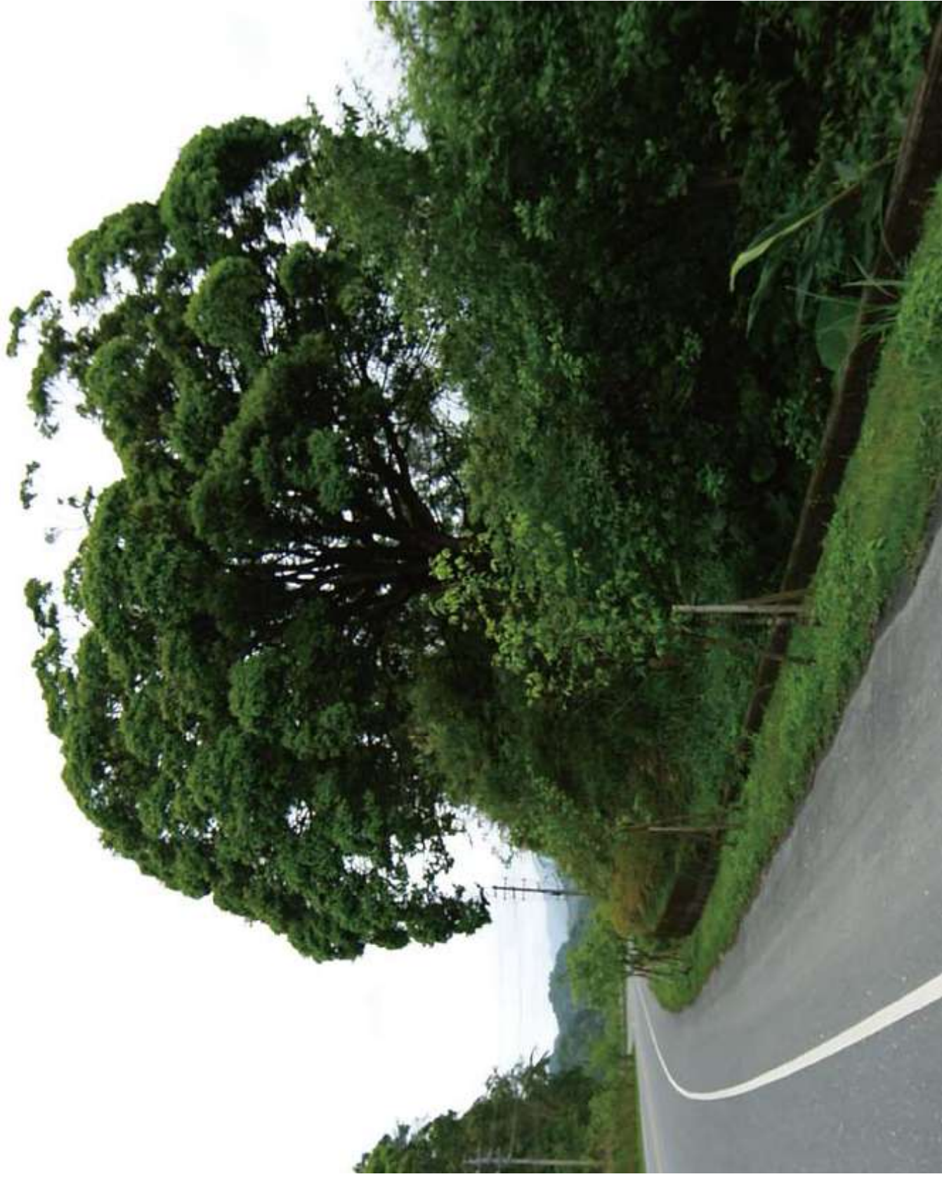
▲位於台七丙省道旁樹型優美的林瀾樹。