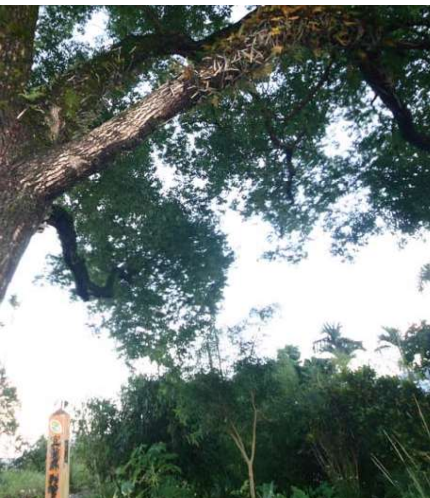
▲老樹下有著榮民弟兄們青壯時期的生活回憶。

屯墾的榮民們後來漸漸安定下來，大夥一一成家立業、結婚生子，也和大樟樹一樣在此落地生根、開枝散葉了。只是當年青壯的榮民弟兄們，如今已多半凋逝，還健在的，也都垂垂老矣。對比於大樟樹猶仍綠意盎然、生機無限的狀態，怎能不感嘆「歲月不饒人」呢？