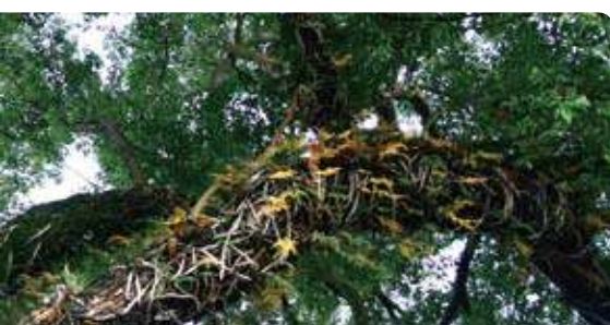
▲樹幹上附生許多的骨碎補。