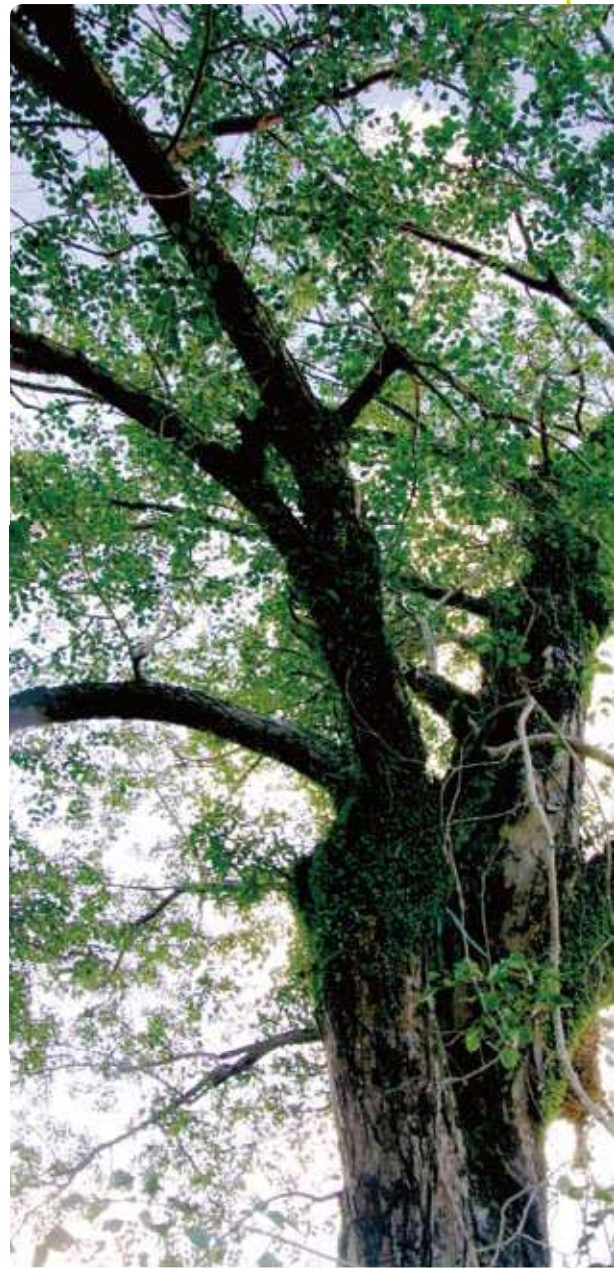
▲目前這棵印度黃檀枝繁葉茂，相當健康。