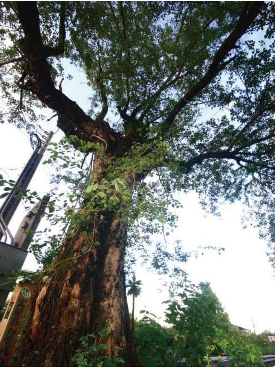
▲老樹下立有「宜蘭珍貴老樹」木樁。